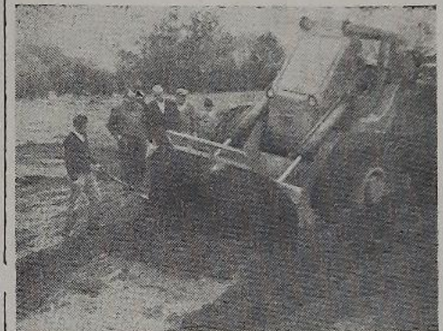
Inicia la pala mecánica la excavación del túnel de acceso al campo de deportes. Presencian los trabajos directivos del Club Figueroa.