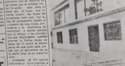
Vista del frente del edificio.