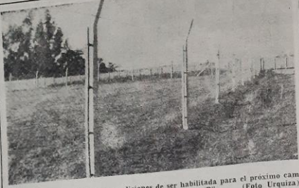
Vista de la cancha. Estará en condiciones de ser habitada para el próximo campeonato oficial. Figueroa deberá actuar en primera "B". (Foto Urquiza).